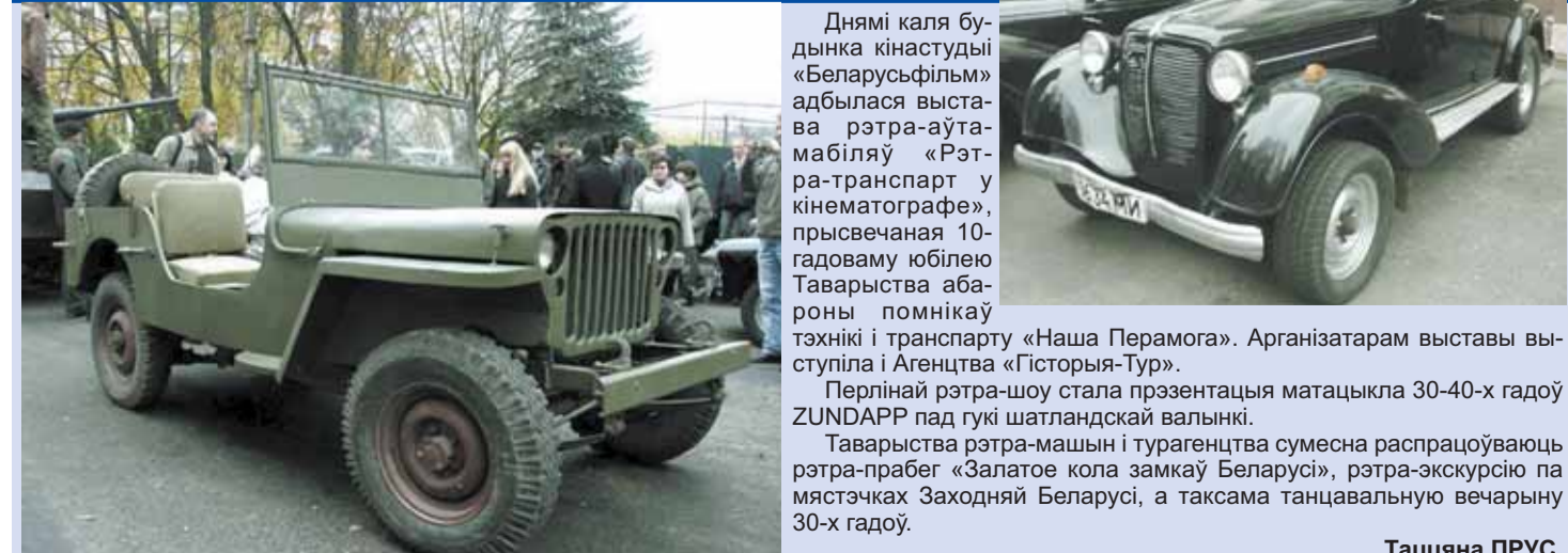
Днямі каля будынка кінастудыі «Беларусьфільм» адбылася выстава рэтра-аўтамабіляў «Рэтра-транспорт у кінематографі», прысвечаная 10-гадоваму юбілею Таварыства абароны помнікаў тэхнікі і транспарту «Наша Перамога». Арганізатарам выставы выступіла і Агенцтва «Гісторыя-Тур».