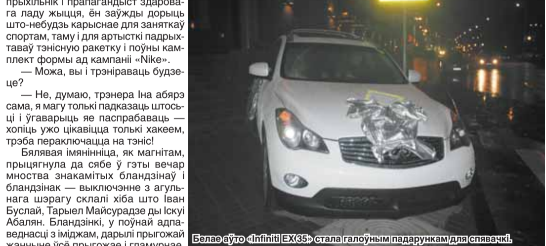
Белая аўта «Інфініці EX35» стала галоўным падарункам для спявачкі.