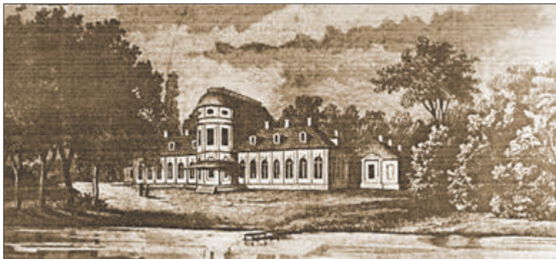
Палац у Шчорсах, якім ён прадстаўлены на старонцы выдання «Tygodnik Ilustrowany» ў 1878 годзе. Дрэварыт.

Да 15 студзеня — Калядны кірмаш у Мінску. Дакладны адрас — Кастрычніцкая плошча і пляцоўка каля Палаца спорту. Нашы калядныя кірмашы не маюць такой славы, якую маюць іншыя еўрапейскія, але гэта, трэба думаць, пакуль. Радасных вам тут пакупаць!