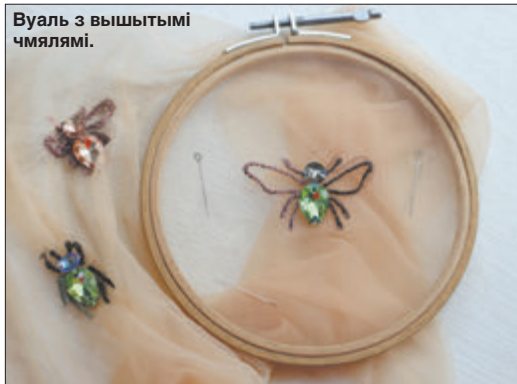
Вуаль з вышытымі чмялямі.

У мяне спінальная цягліцавая атрафія. Таму на вучобу хадзіць не магу. Дома размаўляю праз інтэрнэт з сябрамі, слухаю аўдыякнігі. Сярод любімых аўтараў — Рэмарк. З сучасных — Барыс Акунін: я яго вялікая фанатка.