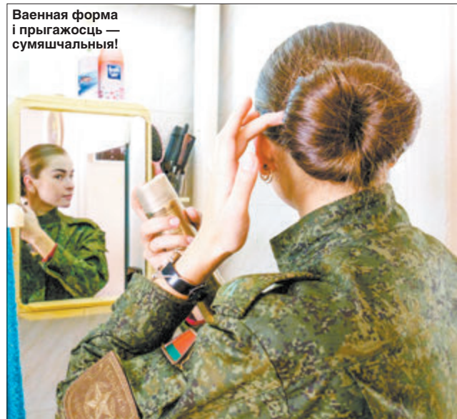
Ваенная форма і прыгажосць — сумяшчальныя!

— Ён у нас агульны як для хлопцаў, так і для дзяўчат. Праграма ўключае прадметы па псіхалогіі — асобаснай, ваеннай, узроставай, педагагічнай. Прычым элемент псіхалогіі ёсць ужо непасрэдна ў моманце знаходжання