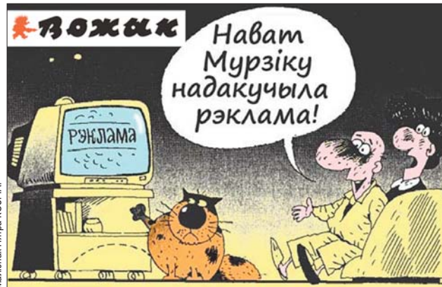
Малюнак Пятра КОЗІНА.

Дзеці, сёння мы пішам сачыненне на тэму: «Хто з маіх знаёмых правёў зімовыя каникулы за мяжой, і чаму мы іх не любім».