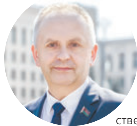
Василий ПАНАСЮК, председатель Минского городского Совета депутатов:

Общественному самоуправлению в столице более 25 лет. В развитие института органов территориального общественного самоуправления значительный вклад внес Минский городской Совет депутатов. Сегодня в городе действуют 127 зарегистрированных комитетов территориального общественного самоуправления. Особенность самоуправления в Минске с его почти двухмиллионным населением заключается в том, что городской Совет депутатов является единственным органом местного самоуправления, так как в районах города аналогичных органов просто нет. Для ликвидации пробела и организации взаимодействия органов территориального общественного самоуправления, оказания им методической помощи в работе на уровне каждого