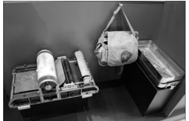
Друкарская машына «Партызанка».

Рэдакцыя «Зарі» знаходзілася акурат паміж дзвюма важнымі чыгункамі — Брэст — Мінск і Брэст — Луцінец. За тры дні да пачатку «рэйкавай вайны» газета выйшла з перадавіцай «Аніводны эшалон ворага не павінен дайсці да фронту». Адказам на заклік сталі пасяховыя вынікі: толькі за першы дзень аперацыі партызаны вобласці ўзарвалі больш за дзве тысячы рэк, чыгуначны рух спыніўся на некалькі су-