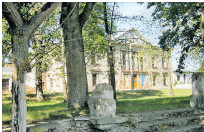
Княжацкая спадчына ўжо чатырнаццаць разоў выстаўлялася на аўкцыён.

Княжацкі палац у вёсцы Паланечка можна купіць па цане іншамаркі