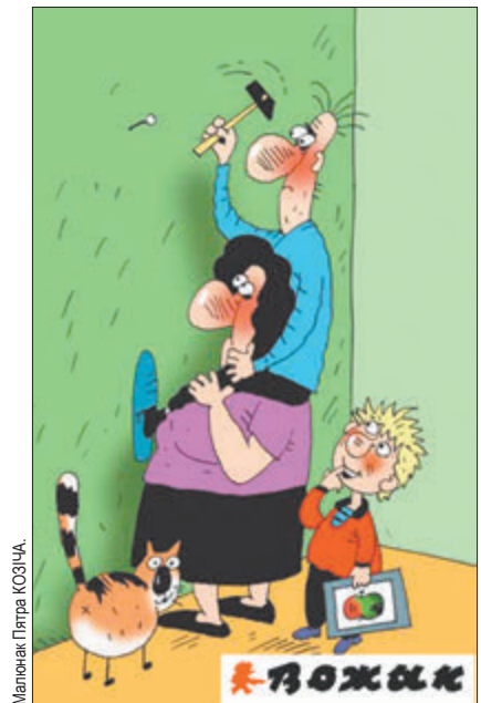
Малюнак Гітэры Козіч.

Размова з мужам. Жонка (пясчотна): — Ты ў мяне такі добры, такі выдатны, такі разумны... Муж (меланхалічна): — Ты разумнейшая. Жонка: — Чаму гэта? Муж: — Ты дома сядзіш, а я працую.