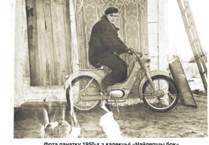
Фота пачатку 1950-х.

сярэдзіны XX стагоддзя, шмат у каго мінулае пачынаецца толькі з пасляваеннага часу. Да таго ж фатаграфія ствараецца дзюкуючы хімічным працэсам і з часам непазбежна разбураецца, выява жаўце, не кажучы пра механічныя пашкоджанні. Тэрмін захоўвання фотаздымкаў, аддрукаваных на барыце ў часы нашых бабуль, — пяць