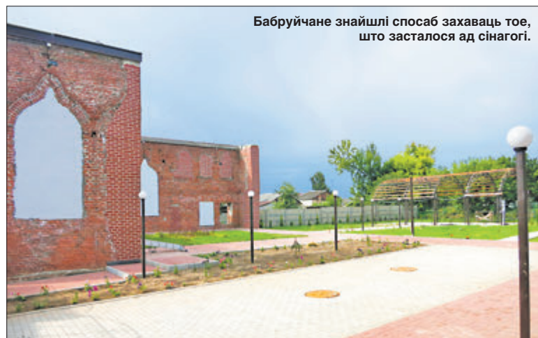
Бабруйчане знайшлі спосаб захаваць тое, што засталася ад сiнагогі.

— Спачатку была ідэя зрабіць на месцы сiнагогі музей яўрэйскай культуры, — кажа Алег Красны. — Гэты ж дызайнер прапанаваў нам праект з інтэграцыяй гістарычных сцен у будынак у стылі хайтэк з выкарыстаннем шкла і бетону. Нам вельмі спадабалася, але гэта