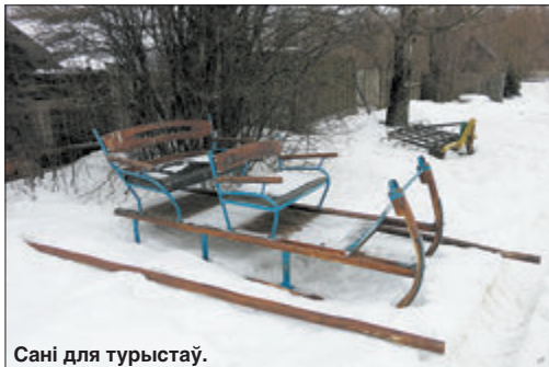
Сані для турыстаў.