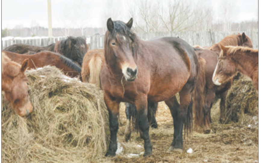
Зорачка — галоўная ў жаночым «батальёне».

Кабылкі пасуцца асобна. Кармоў для іх нарыхтавана з запасам, на мой погляд, не на адзін табун хопіць. «Дзяўчаты» спачатку на нас не рэагуюць. Потым адна з іх адрываецца ад ежы і накіроўваецца да гаспадара. «Гэта сяброўка Рупара», — знаёміць Юрый і ласкава дадае: — Зорачка. Адчуваецца, што яна галоўная ў гэтым