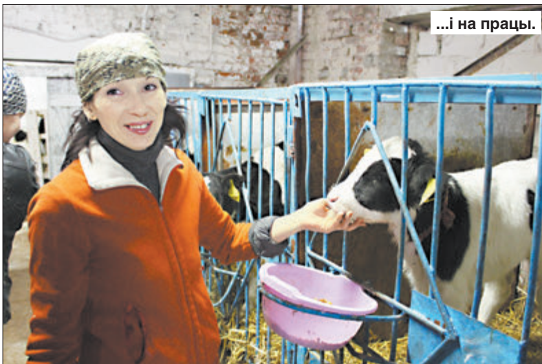
...і на працы.

рылі ўсе ўмовы. Нават вялізную бочку з цёплай вадой прывезлі, бо водаправод да будынка не падведзены.