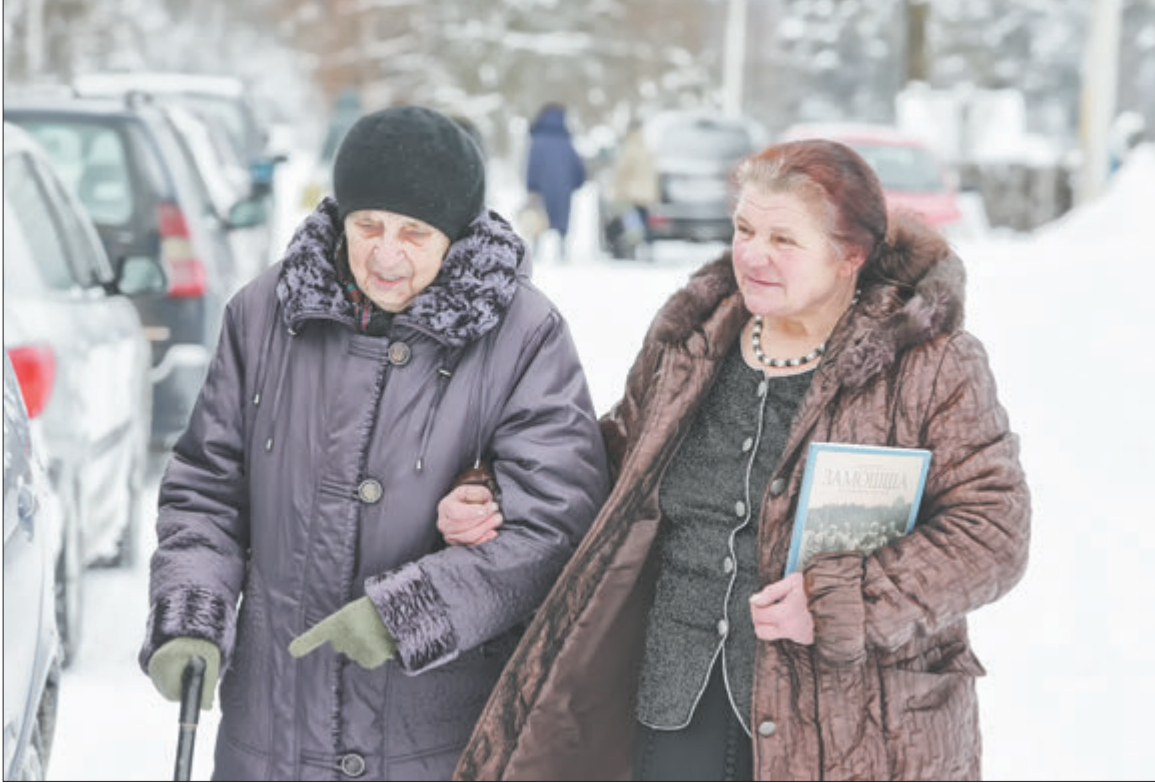
Больш здымкаў глядзіце на сайце zviazda.by .