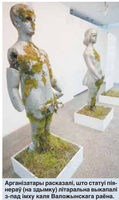
Арганізатары расказалі, што статуі піянераў (на заднім плане) літаральна выкапалі з-пад імху каля Валожынскага раёна.

Многія, хто наведвае Мінск, лічаць, што ён у нечым амаль як машына часу, што вяртае цябе ў СССР. У характарах, паводзінах тых, хто насіў чырвоны гальштук, так ці інакш выплывае «піянерская вытрымка».