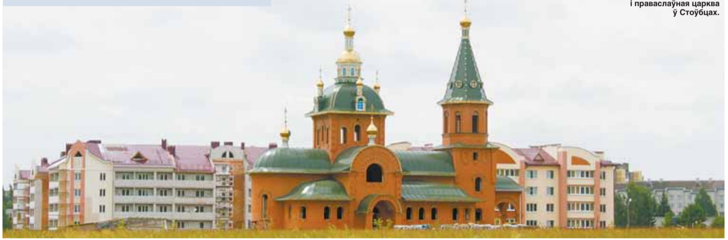
Новы мікрарайон і праваслаўная царква ў Стаўбцах.