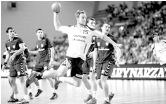
БГК імя Мясцова зняў трыццаць месца на прадстаўнічым гандбольным турніры ў Польшчы.