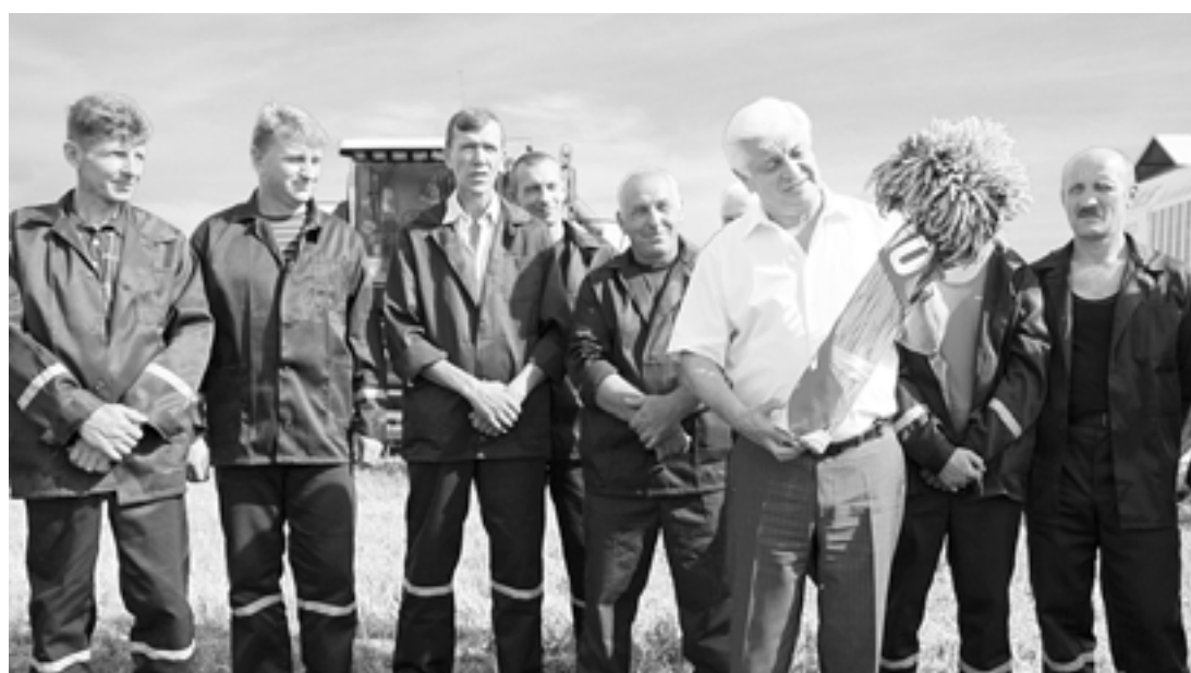
(Заканчэнне. Пачатак на 1-й стар.)

Усяго на жыве ў вобласці задзейнічана больш за 30 тыс. чалавек і каля трох з паловай тысяч адзінак тэхнікі. Працуюць больш за 2 тыс. камбайнерскіх экіпажаў. Паводле аперацыйных даных, у Мінскай вобласці 142 камбайнерскія экіпажы намалалі больш за 1 тыс. тон збожжа і столькі ж перавезлі 150 кіроўцаў.