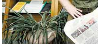
«Звязда» і ў арміі шануюць!

— Я не скажаў бы, што зараз у арміі існуе дэфіцыт ваеннаслужачых гэтай катэгорыі, але нельга сказаць, што ёсць вялікі прыток спецыялістаў. Аднак моладзь цікавіцца гэтым званнем. Нядаўна да нас прыйшоў ліст, у якім пытаўся, што неабходна зрабіць, каб