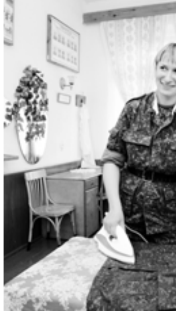
Разам з хлопцамі армейскую аэзбуку ў 72-м аб'яднаным вучэбным цэнтры спэцыялістаў дзяўчат.

— У іх ёсць абавязковыя стрэльбы на палігоне, кіданне баявой гранаты. Зразумела, ёсць тыя, хто напачатку палохаецца зброі, хвалюецца. Але пасля шэрагу трэніровачных заняткаў усё выконваюць нарматывы, а нехта