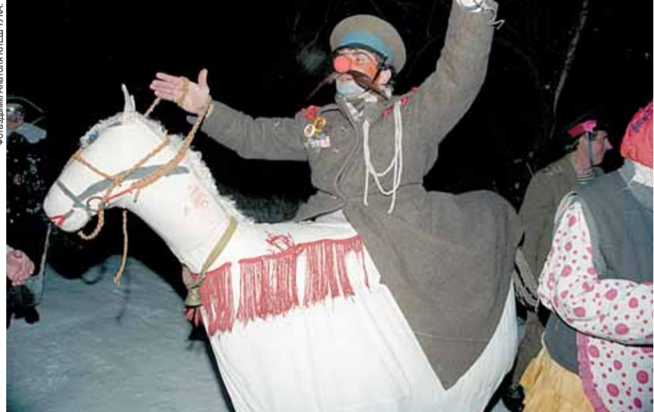
Калядны абрад «Конкі» у Давыд-Гарадку Столінскага раёна Брэсцкай вобласці.