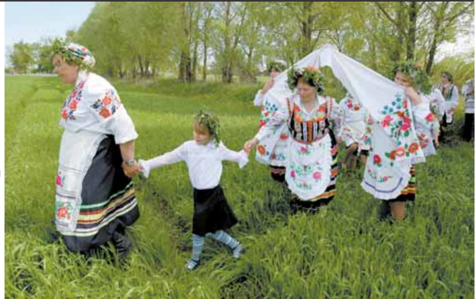
Абрад «Юраўскі карагод» у вёсцы Пагост Жыткавіцкага раёна Гомельскай вобласці.