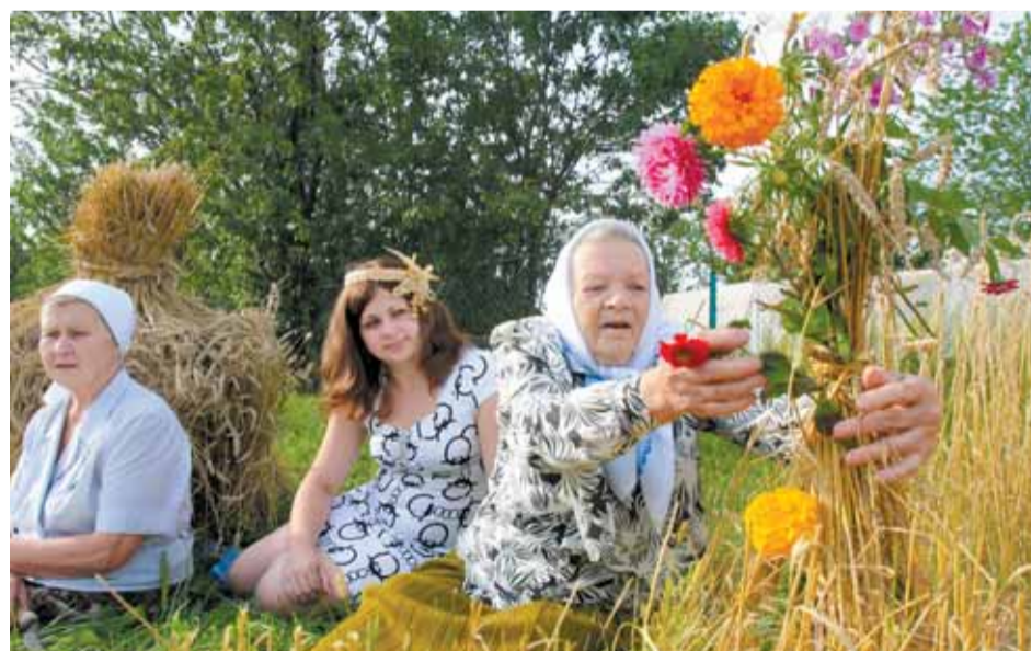
Жыццёвы абрад «Завітанне барады». Выканаўцы — удзельніцы фальклорнага калектыву «Матрынская спадчына», в. Матрына Ушацкага раёна Віцебскай вобласці.