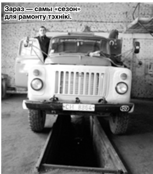
Зараз — самы «сезон» для рамонту тэхнікі.

Ганна ГАРУСТОВІЧ. Мінск — Ашмянскі раён — Мінск.