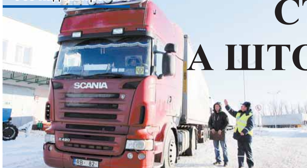
Аўто з грузам трапляе на кантрольна-прапускны пункт. Тут машыну абыходзіць кантралёр Аляксандр ВАУЧОК, каб ідэнтыфікаваць грузавік.