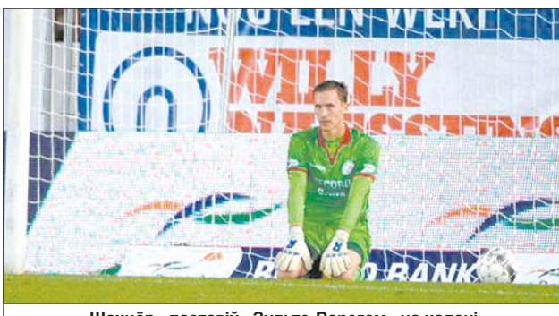
«Шахцёр» паставіў «Зультэ-Варгем» на калені.