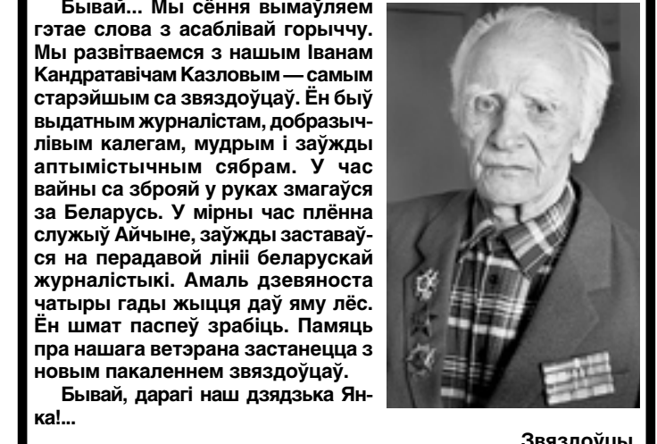
Тарас Шчыры.