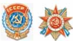
Выдаецца з 9 жніўня 1917 г.