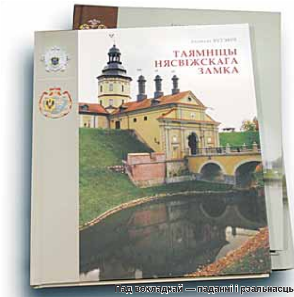
Людзі вокладкай — гаданні і рэальнасць.

Ніна ШЧАРБАЧЭВІЧ, Фота Яўгена ПЯСЕЦКАГА.