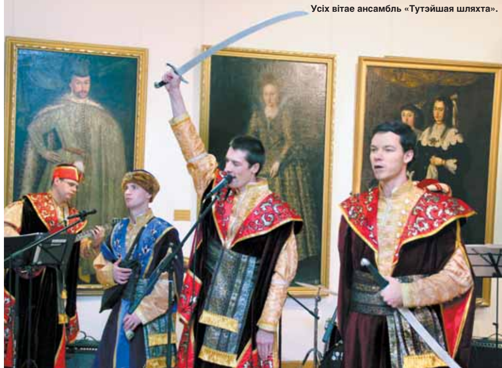
Усім вітае ансамбль «Тутэйшая шляхта».

Аргумент пра «каралеўства» робіцца яшчэ больш важкім, калі ўлічыць, што з нашай зямлі паходзіла ўсяго 3 каралевы. Першая — тая