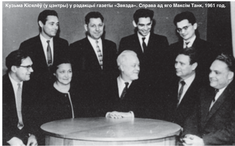
Кузьма Кісялёў (у цэнтры) у рэдакцыі газеты «Звязда». Справа ад яго Максім Танк, 1961 год.

Беларускую дэлегацыю разам з украінскай пасадзілі ў самалёт і адправілі таксама быццам бы ў Лондан. Шторкі былі апушчаны, у кабінце знаходзіліся ахоўнікі. Ляцелі доўга. Калі прызымліліся, аказалася, што гэта... Навасібіск. Толькі там яны дэведліся, што накіроўваюцца ў ЗША. Яшчэ адзін пералёт на Аляску, а адтуль — у Сан-Францыска. Менавіта там Кузьма Кісялёў, сярод прадстаўнікоў 50 іншых краін, што ўдзельнічалі ў заснаванні ААН, падпісаў Статут гэтай арганізацыі. Нямецкая разведка была падманута.