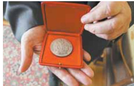
Паскі медаль «Вогнішча веры».

назвай нашай краіны напісана няправільна. Ён стаў патрабаваць, каб замест «White Russia» напісалі «Belorussian SSR». З тых часоў нашу краіну ў свеце сталі ведаць з яе правільнай назвай.