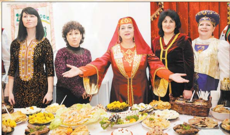
Народнае аматарскае аб'яднанне «Шматгалоссе» Касцюкоўскага цэнтра нацыянальных культур Барысаўскага раёна.

У Маладзечне прайшоў X фестываль нацыянальных культур, у якім узялі ўдзел прадстаўнікі 10 нацыянальнасцяў з 9 рэгіёнаў Мінскай вобласці.