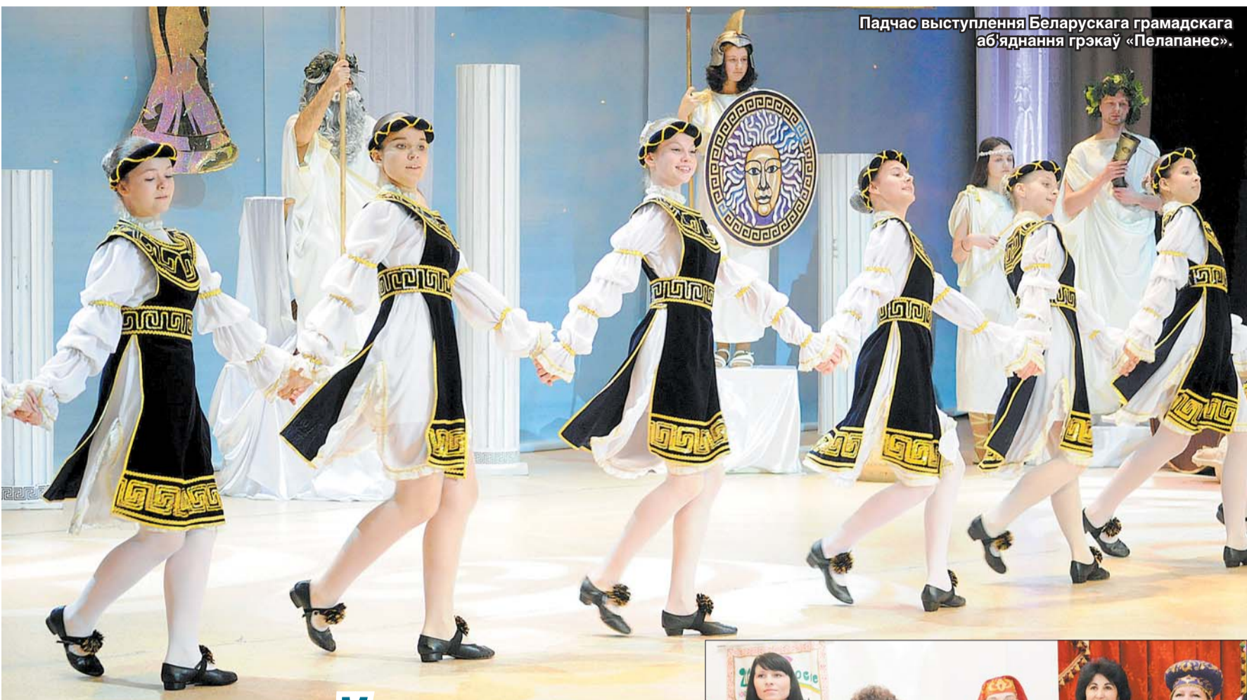
Падчас выступлення Беларускага грамадскага аб'яднання грэкаў «Пелопанес».