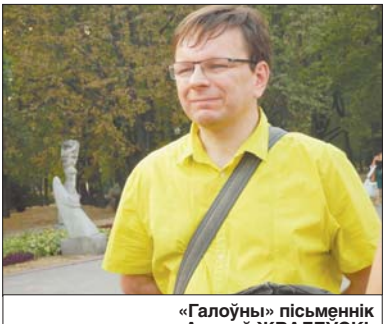
«Галоўны» пісьменнік Андрэй ЖВАЛЕУСКІ.

Для стварэння гісторыі выбралі галоўнага аўтара, ім стаў вядомы пісьменнік Андрэй ЖВАЛЕУСКІ.