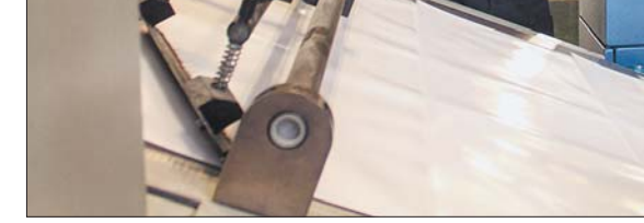
Машына працуе, аднак без нагляду не абісціся.

У ахвяру гэтаму помніку прынеслі яшчэ адзін, які, без перабольшвання, можна было б назваць гісторыка-культурнай каштоўнасцю.