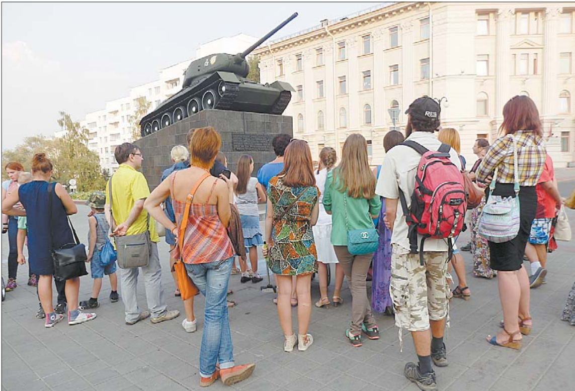
Адначасова сапраўдны і несапраўдны танк.

— Мы даўно хацелі паспрабаваць напісаць сумеснае апавяданне, і тут быў аб'яўлены конкурс сацыяльных праектаў (конкурс #РазамМінск, пра які «Звязда» ўжо пісала.