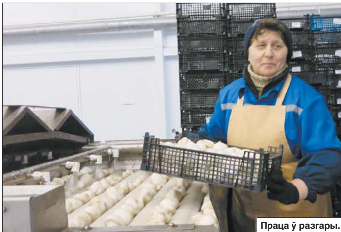
Праца ў разгары.

Сёлета таварыства нарыхтавала 150 тон чарніц і на столькі ж аказала паслуг. Акрамя чарніц, марозяць тут і садовыя ягады. Наогул, асартымент складае 32 найменні.