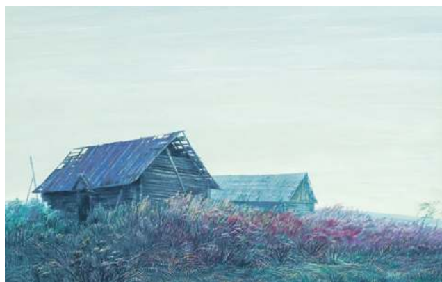
«Старая школа», 1988 г.

Жывапісец апяваў прыродную прыгажосць Беларусі, але гэта толькі адзін слой сэнсавага палатна мастака. Валерый Шкаруба праз звыклія дэталі выяўляў вечныя сімвалы, зразумелыя кожнаму. Для глядача, які звык да актыўнага дзеяння, выключных персанажаў ці лірычнага краявіду, здольнага парадаваць вока рэалістычнасцю карцінкі ці адмысловым прадстаўленнем прыроды, яго работы могуць падацца занадта стрыманымі і нават псімістычнымі. Ужо толькі назвы некаторых («Змрок»,