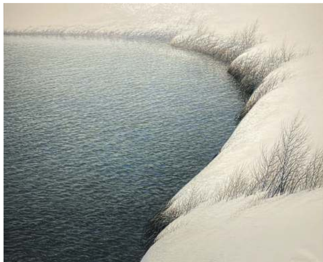
«Ціхая затока», 2014 г.