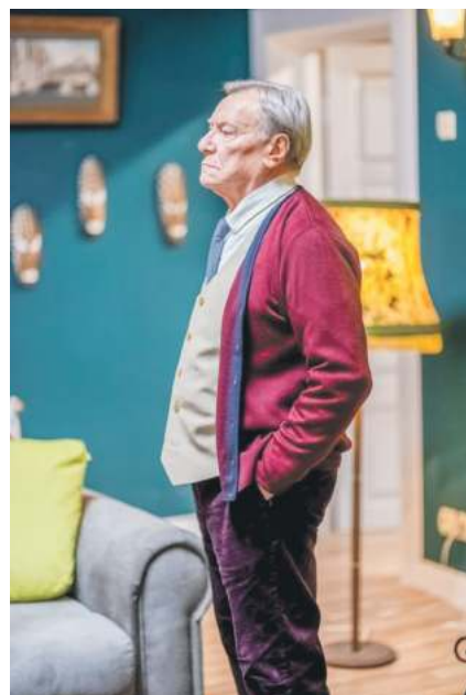
Народны артыст РСФСР Сяргей Шакураў у вобразе бацькі сямейства, народнага артыста СССР, Расіі і Беларусі Міхаіла Верына.