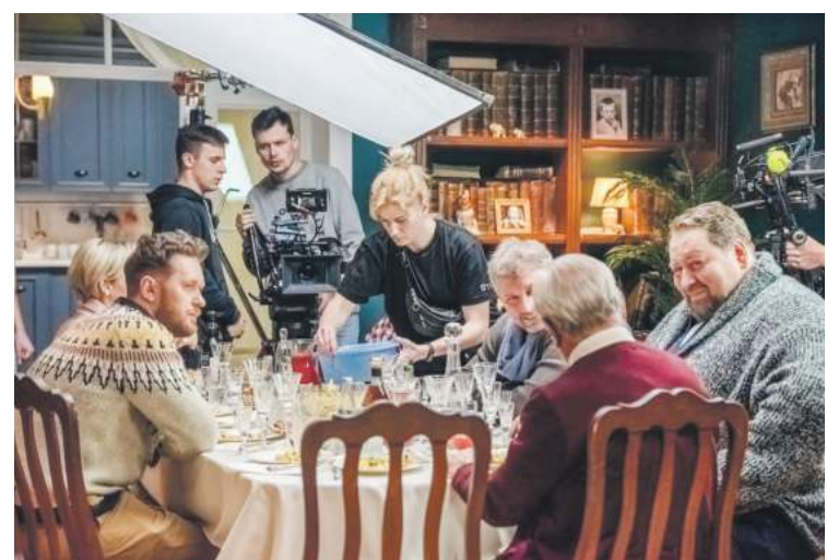
На здымачнай пляцоўцы.

Зрэшты, стваральнікі «Аліўе» параўноўваюць уласную работу, натуральна, не з фільмамі «румынскай новай хвалі», а, ні многа ні мала, з разанаўскай застольнай класікай — «Іронія лёсу», неадэмным спадарожнікам Новага года для мільёнаў сям'яў па ўсім былым Савецкім Саюзе. Але ж праўда ў тым, што, акрамя хіба праславутага стала, салатаў ды святочнага антуражу, паміж новым «Аліўе» і згаданым фільмам 1975 года не так і шмат перасячэнняў. Куды больш іх — з іншай класічнай карцінай Эльдара Разанава пад назвай «Гараж» (1979). Да рукапрыкладства тут, канешне, не дойдзе (хаця, магчыма, і не пашкодзіла б), але выхадныя даныя падобныя — група людзей, яркіх характараў, гэтаксама ўвесь час «высвятляе» адносіны, не выходзячы за межы аднаго памяшкання.