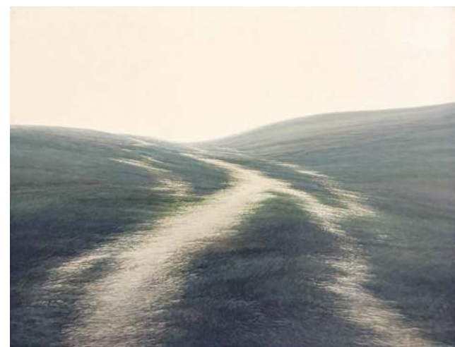
«Да невядомага», 2006 г.

Заўсёды цікава, якую работу таго ці іншага мастака вылучаць у якасці цэнтральнай куратары праекта. У прасторы, дзе змешчана выстаўка «Валерый Шкаруба. In Memoriam», зрабіць гэта асабліва лёгка — звычайна такі твор экспануецца на своеасаблівай лесвічнай клетцы каля ўвахода ў галоўны корпус. Гэтым разам асноўным стала палатно «Сон зямлі» (2017) са збору сям'і жывапісца — пераасэнсаванне аднаго з ключавых сюжэтаў айчыннага мастацтва. Гэта своеасабліва версія не толькі знакамітага сюжэта, але і рэальнага краявіду, які б ён ні быў. Характарыстыкі творчасці аўтара — імкненне да парадку, адасобленасць ад мітуслівага свету — уласцівы і гэтай рабоце. Прастора палатна, абмежаваная наўмыснай фрагментарнасцю, становіцца месцам для паглыблення ў свет думак і пачуццяў. Ніхто не перашкодзіць стваральніку пазбавіць кампазіцыю ад выпадковай прысутнасці іншых.