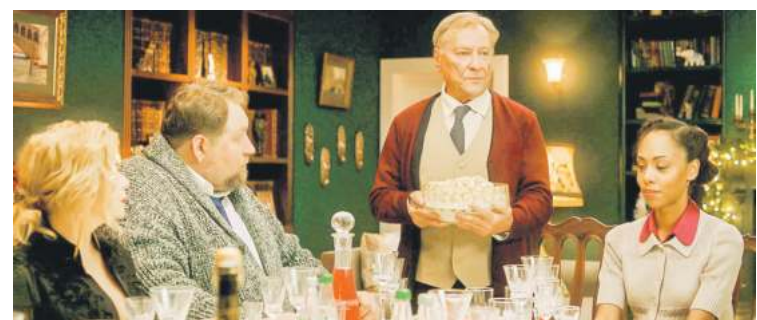
Кадры з фільма.

адмаўляцца не стаў, але ж нясучую функцыю выконваюць менавіта сольныя выступленні. Займальная, трэба сказаць, ідэйка! Тым больш што напісаны маналогі таленавіта ды па-майстэрску (хоць асобныя пасажы і выдаюць агульнага аўтара).