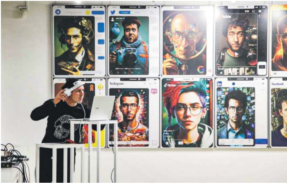
Калі б сацсеткі былі людзьмі.

На падставе вопытаў і філасофскіх дыспутаў сфармулявалася асноўная ідэя філасофіі штучнага інтэлекту — гіпотэза моцнага і слабага інтэлектаў. Прыхільнікі першага (А. Цьюрынг, Д. Макараці, Д. Сёрл) мяркуюць, што камп'ютары змогуць атрымаць магчымасць думаць і ўсведамляць сябе як асобную персону, разумець уласныя думкі, хоць не абавязкова працэс гэты будзе падобны да чалавечага. Тэарэтыкі слабага штучнага інтэлекту (А. Ліэта, Р. Пенроўз) упэўнены, што камп'ютарная свядомасць не зможа стаць паўнаважнай.