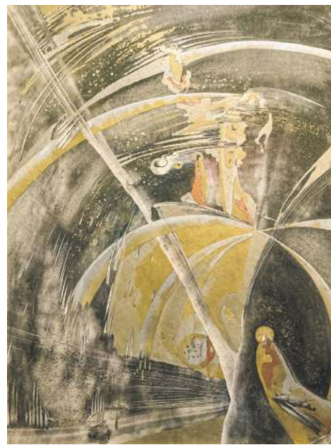
З серый «Узаемапранікненне». № 2, 2013 г.

Апошні дзень работы экспазіцыі — 5 сакавіка. Дарэчы, Мікалай Аўчыннікаў паўстае перад глядачом не толькі як майстар пейзажа, але і як эксперыментатар. У Мастацкім ён прадставіў паўабстрактныя (творца называе іх «беспрадметныя») кампазіцыі з серый