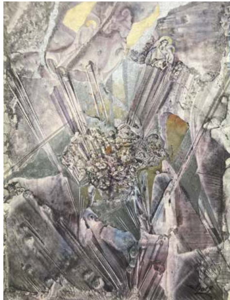
З серый «Тайна квазара». № 3, 2019 г.