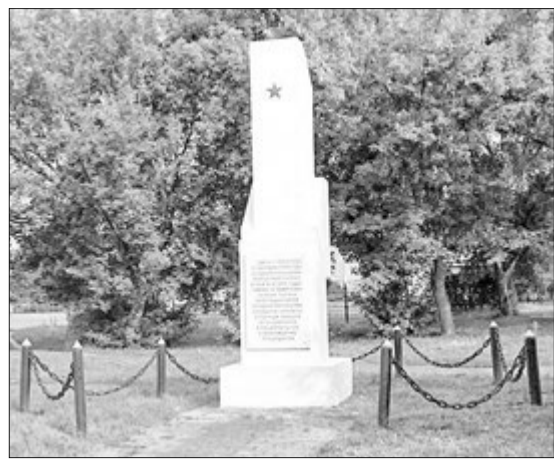
(Заканчэнне. Пачатак на 1-й стар.)