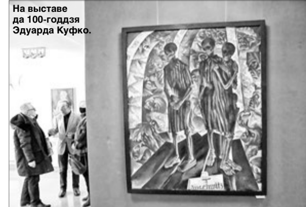
На выставе да 100-годдзя Эдуарда Куфко.

Яго палотны — страшная праўда лагераў, спачатку фашысцкіх, потым ГУЛАГа. З карцін глядзяць вязні. А мастак гаворыць з намі жорстка, непрывава, па праве відавочцы, па праве пакутніка. Усе гэтыя дарогі, адлюстраваныя на карцінах, ён прайшоў сам. Стагадоў юбілейнае свецтва вядомага мастака Эдуарда Куфко адзначалі ў Брэсце выставай яго карцін.