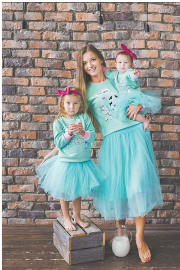
Такія світшоты з вясёлымі прынтамі пачала выпускаць маладая мама.