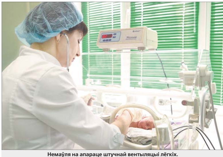
Немаўля на апарце штучнай вентыляцыі лёгкіх.