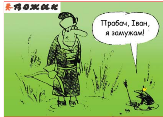
Малюнак Уладзіміра ЧУГЛАБАВА.

Муж мармыча жонцы скрозь сон: — Любая, здымі з мяне тапачкі і выключы тэлевізар. — Пацярпі, мой пупсік. Мы яшчэ ў тэатры.