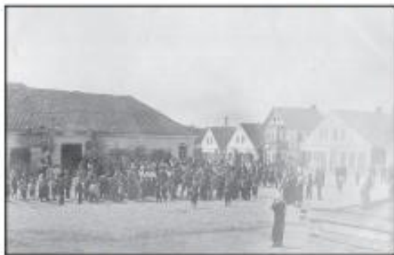
Высока-Літоўск (Высока), Камянечкі р-н. Гарадніца плошча.

Камянец — самы блізкі гарадок да гараднэй часткі Белавежскай пушчы. Сваю атмасферу знаёмства з гэтым краем надае і легендарная Камянечка вежа, Камянечкі стоўп... Пабудаваны гэты помнік у 1271—1288 гадах. У даўнейшыя стагоддзі вежа выконвала абарончую ролю, вытрымлівала штурмы крыжаносцаў, польскіх войскаў і літоўскіх князюў... Калі вежа страціла абарончую ролю, яе спрабавалі разабраць на дрэты. Не змаглі! Цягла і зябка так зацвердзелі, што ўвесь стоўп як быццам пераўтварыўся ў адны валюны каменя.