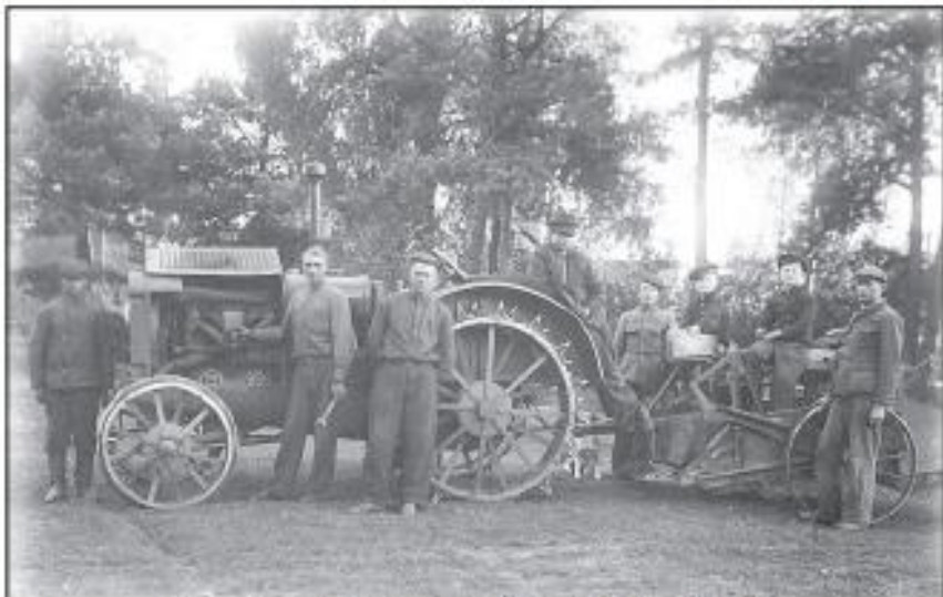
Высока, Камянечкі р-н. Падыстоўка тэхнікі да ўборкі ўраджая. 1930-я гады.

У 1968—1973 і 1996—2003 гады былі праведзены рэстаўрацыйныя работы. У Камянечкай вежы цяпер знаходзіцца філіял Брэсцкага абласнога краязнаўчага музея.