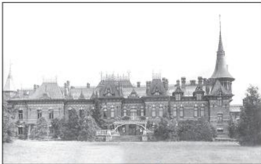
Палац культуры ў Белавежскай пушчы.