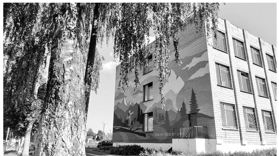
Сярэдняя школа № 3 г. Асіповічы.

працуюць». Немалаважна, што праекты «АРХідэі» дазваляюць студэнтам выйсці за рамкі ліста паперы і ператварыць свае задумы ў жыццё. У рэшце рэшт, удзел у падобных мерапрыемствах — цудоўная магчымасць рэалізаваць уласны патэнцыял, напрацаваць партфоліа. За