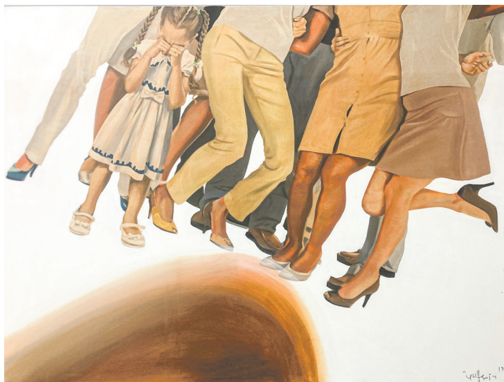
«Bad photo», 2019 г.