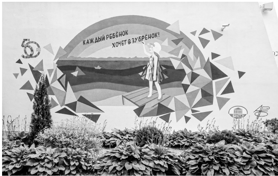
Росніц у «Зубраняці».

Акрамя таго, што на выстаўцы быў прадстаўлены асобны прэзентацыйны стэнд факультэта, арганізатары паклапаціліся і аб рэалізацыі асветніцкай функцыі: цэлы дзень 17 сакавіка прастора публічнага лекторыя належала навучэнцам архітэктурнага факультэта. У рамках лекторыя студэнты прадставілі 27 праектаў у 5 напрамках: «Універсальны дызайн»