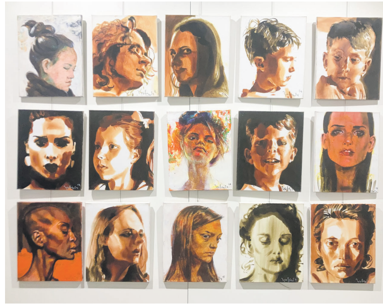
«Дэмаграфія I», 2020—2022 гг.

насці, а некаторыя работы не проста намякаюць на фотаапарат, а спасылаюцца на яго наяўнасць. Гэта і своеасаблівыя партрэты, у тым ліку групавыя. Найбольш звяртае на сябе ўвагу «Маскарад (2022) з «героямі сучаснасці», і аўтапартрэт (2021), і «няўдалы здымак» («Bad photo», 2019). Такім чынам Сяргей Грыневіч дасягае неабходнага рэалізму, не пазбягаючы элементаў постмадэрнізму. Названыя работы — не самыя ярковыя прыклады, таму раім убачыць іншыя творы на свае вочы. Выстаўка працуе да 3 красавіка.