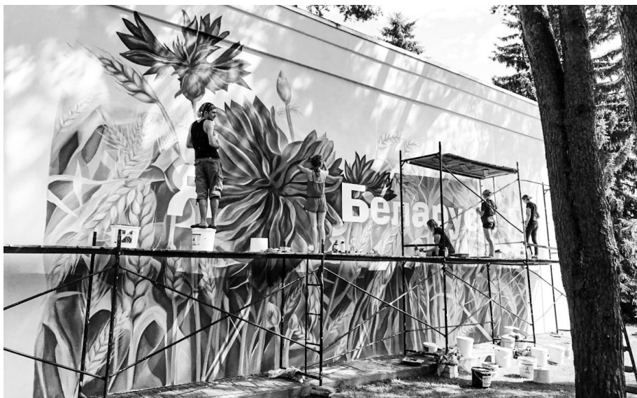
Падчас работы ў «Зубраняці».

Пасля паездкі навучэнцаў пад кіраўніцтвам дэкана Армена Сардаравы ў асіповіцкую сярэднюю школу № 3 і прывядзення замераў на факультэце быў абвешчаны паўнаватасны конкурс. Перамога эскізнага праекта студэнткі Марыі Анкудовіч. Сярэдняя школа № 3 горада Асіповічы — установа з экалагічным ухілам, адсюль і прыродныя матывы ў малюнку. Каб стварыць спрыяльную атмасферу для паўсядзённага жыцця, важна гарманічна ўпісаць мурал у асяроддзе, улічыць і прызначэнне аб'екта,