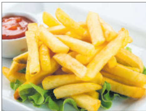
Сёння адна з важных задач — стварэнне айчынных сартоў для вытворчасці чыпсаў і бульбы фры.

А ў цэлым сучасныя падыходы да селекцыі бульбы прадугледжваюць мэтавае прызначэнне сартоў. Гэта датычыцца і «сталовых»: тут створаны спецыяльныя сарты менавіта для супоў і салатаў (так званыя салатныя — напрыклад, «Скарб», «Брыз», «Першацвет»), а таксама для пюрэ («Журавінка», «Рагнеда», «Вектар» і г. д.).