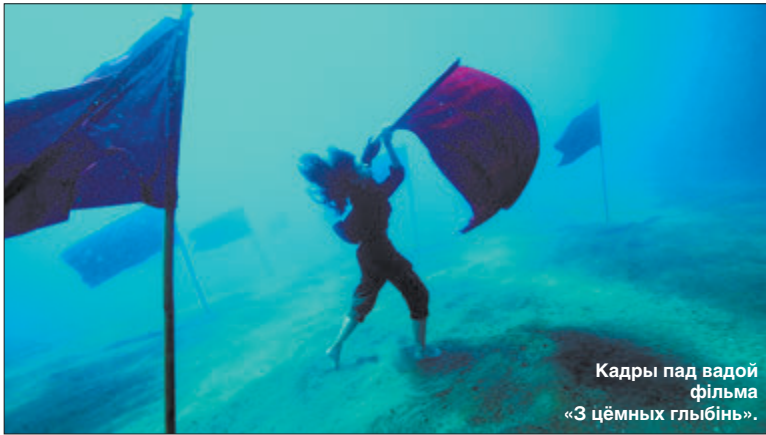
Кадры пад вадой фільма «З цёмных глыбін».

У двух фільмах з Бразіліі знайшліся актуальныя палітычныя пасылы. «Фільм для Эхуаны» ходзіць за сваёй гераіняй з абшчыны Яномамі, што мае, можна сказаць, племянны лад жыцця. У канцы фільма гучыць закадравы голас, напэўна, прадстаўніка «жыхароў лесу», які кажа, што не дасць ураду выгнаць іх з гэтай зямлі. Другая бразільская карціна «больш сумна, чым час гульні ў дажджлівы дзень» сарыентавалася ў палітычным полі віртуознай і запаралеліла выступ-