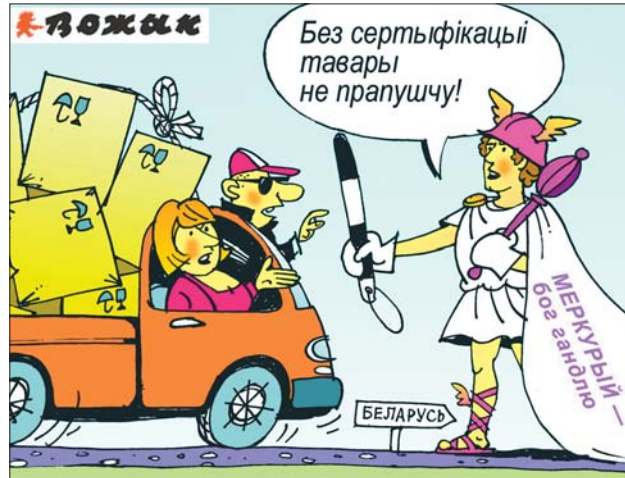
Малюнак Міколы ПРЭТЭЯ.