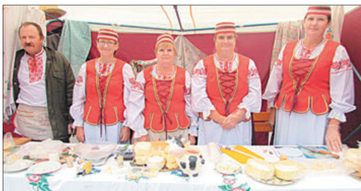
Сельскагаспадарчы кааператыву «Гіжэнскі аграрый» на сырнай ярмарцы ў г. Слаўгарад.

Разам з тым узровень абслугоўвання насельніцтва і малых формаў гаспадарання на вёсцы застаецца недастатковым. Доля сельгаспрадукцыі, якая закупляецца ў гаспадарцы насельніцтва арганізацыямі Белкаапсаюза, нязначная і