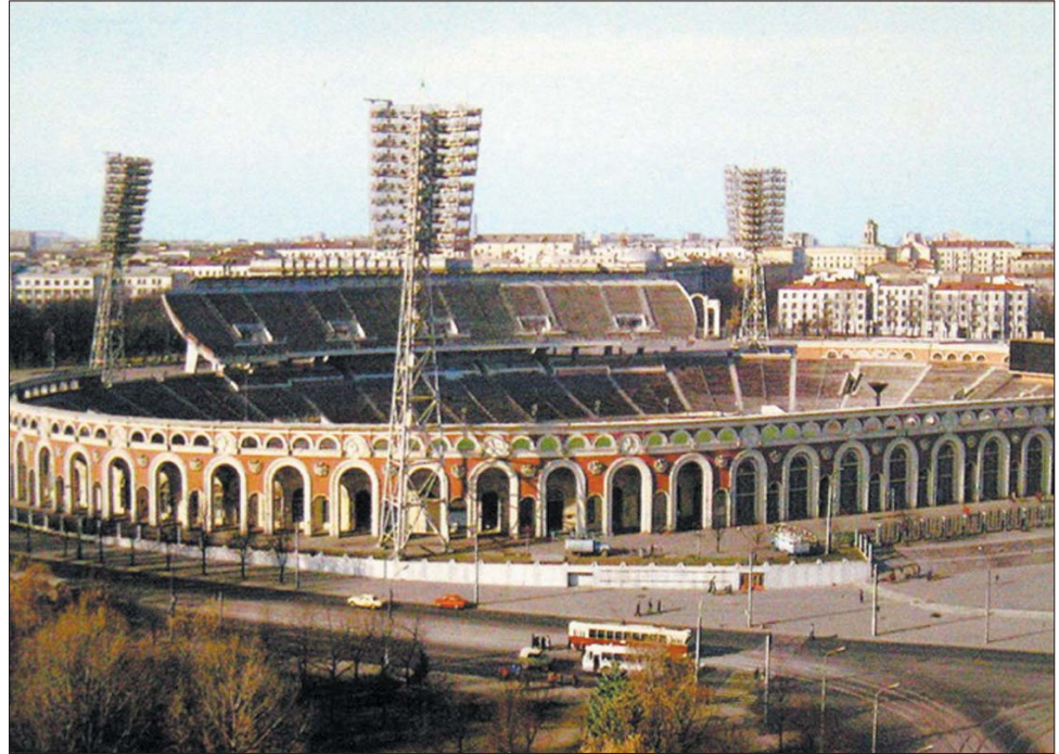
Рэпрадукцыя з паштоўкі 1983 г.

Падчас будаўніцтва інжынер праекта трыбуны-казырка эміграваў у Ізраіль, а па горадзе пайшла чутка, што пры поўнай загрузжанасці казырок можа зваліцца на заходні сектар. Аднойчы ноччу па трывозе паднялі каля 12 тысяч курсантаў і салдат, каб выпрабаваць устойлівасць збудавання, пасля выпрабавання канструкцыю ўдасканалілі. Аднак трыбуна-казырок так і не стала ідэальнай — падчас дажджу залівала ложу, а зімой там абледзеньвалі прыступкі. Дарэчы, толькі ў канцы 1990-х казырок перасталі вы-