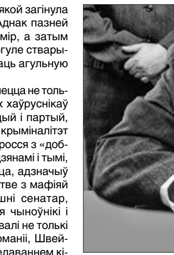
Мафія і бандыты ў Італіі.

Пералічваючы ўчыненыя абвінавачанымі злычынствы, суддзя згадаў і раскраданне дапамогі Брунэла, назваўшы яго «каласальным махлярствам, якое заключаецца ў раскрадванні датацый Еўрасаюза ў велізарных маштабах і даведзена да дасканаласці». Сенатар Марыяла Джыаруа, які шмат гадоў змагаецца з аргзлачыннасцю, выказаў надзею, што ў ходзе працэсу ўдасца выявіць механізм гэтай аферы агупнаўрапейскага маштабу. Ён таксама звярнуў увагу на змену падходу судовага аргзлачыннасцю, выказаў надзею, што ў ходзе працэсу ўдасца выявіць механізм гэтай аферы агупнаўрапейскага маштабу. Ён таксама звярнуў увагу на змену падходу судовага аргзлачыннасцю, выказаў надзею, што ў ходзе працэсу ўдасца выявіць механізм гэтай аферы агупнаўрапейскага маштабу. Ён таксама звярнуў увагу на змену падходу судовага аргзлачыннасцю, выказаў надзею, што ў ходзе працэсу ўдасца выявіць механізм гэтай аферы агупнаўрапейскага маштабу.