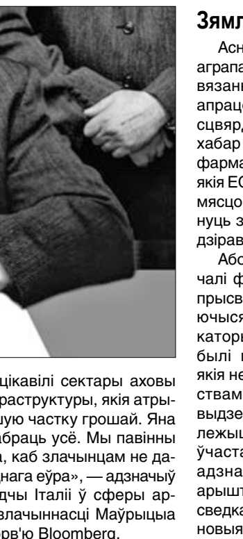
Мафія і бандыты ў Італіі.

На мінулым тыдні Анточы наведваў судовае пасяджэнне ў Ламецыя-Тэрма. «Я хачу паглядзець у вочы тым, хто дзейска паддзяліў трымаў гэтую зямлю ў заложніках», — сказаў ён журналістам. Па словах Анточы, ахвярамі мафіі сталі не толькі Еўрасаюз і падаткапалачельшчыкі садружнасці, але таксама італьянскія жыхары —