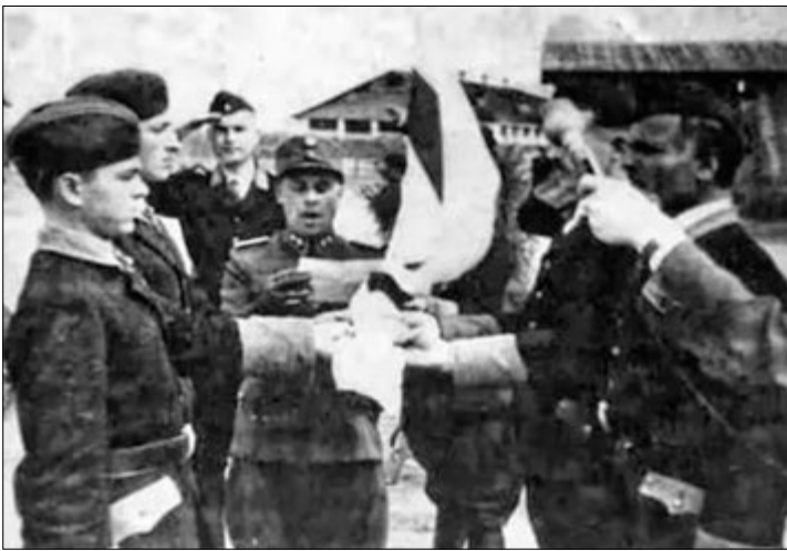
Прыняцце прысягі на вернасць рэйху членамі СБМ.