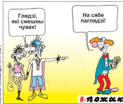
Малюнак Аляксандра ПІТРОВА.