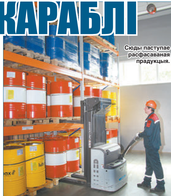
Студы паступае расфасаваная прадукцыя.

— Перш за ўсё — па сістэме кіравання якасцю ISO 9001 па самай апошняй версіі 2015 года; кіравання навакольным асяроддзем, зноў жа ў версіі 2015 года. І па ахове працы. Прадукцыя наша таксама прайшла адпаведную сертыфікацыю — з улі-