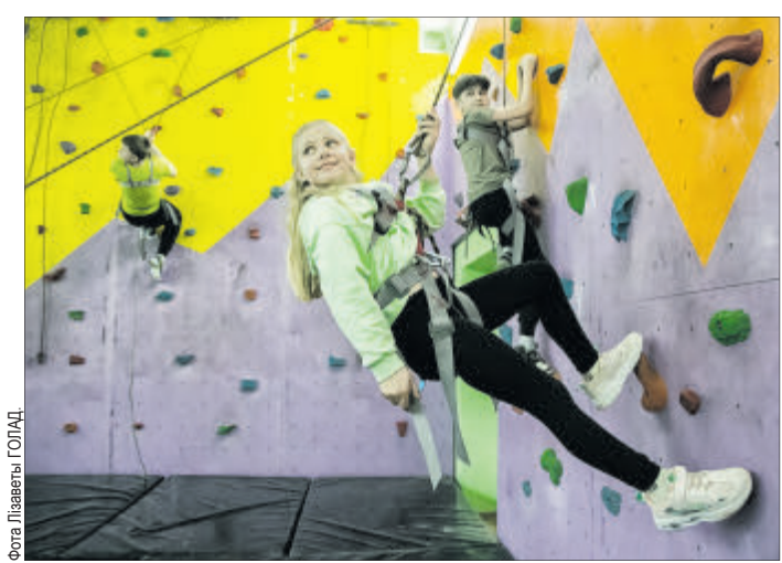
Выхаванцы аб'яднання па інтэрэсах «Юныя скалалазы» падчас заняткаў.