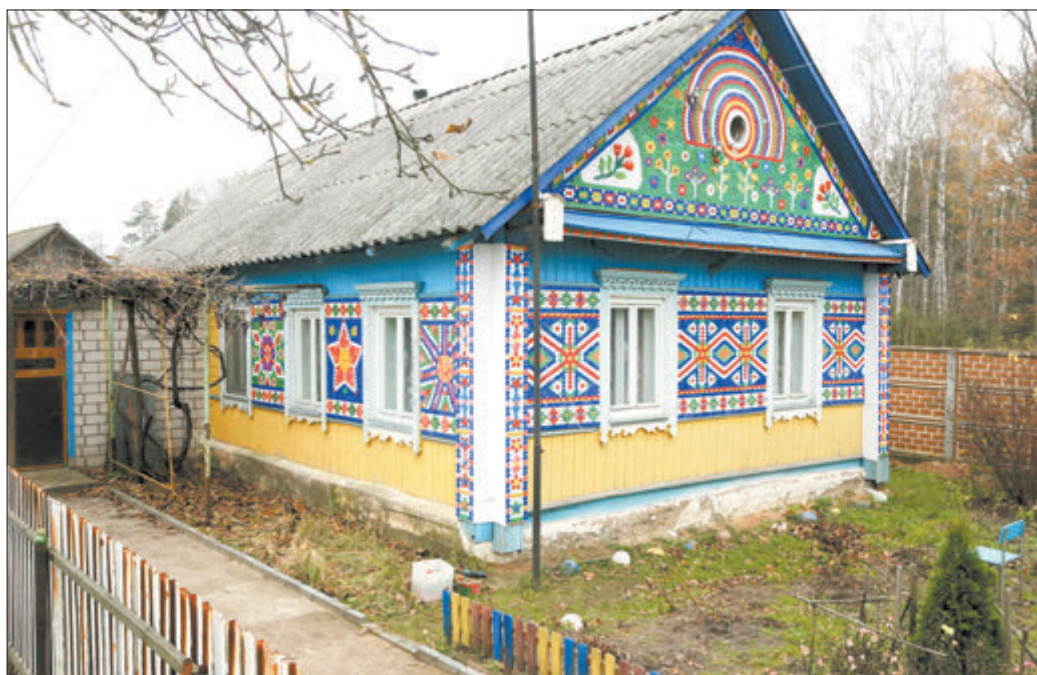
(Заканчэнне. Пачатак на 1-й стар.)

Убачыўшы гэты вясёлы дом у вёсцы Плянта Салігорскага раёна, адразу ўспомніў дзіцячую цапку — калейдаскоп: паглядзіш у шкляное акенца — а там якога толькі дзіва няма: і зорачкі, і ромбікі, і кветачкі. Вось і гэтая вясковая пабудова з ярка выражанай мазаікай на фасадзе нагадвае вясёлку на фоне шэрага лістападаўскага неба! Казка! Як тут не спыніцца?!