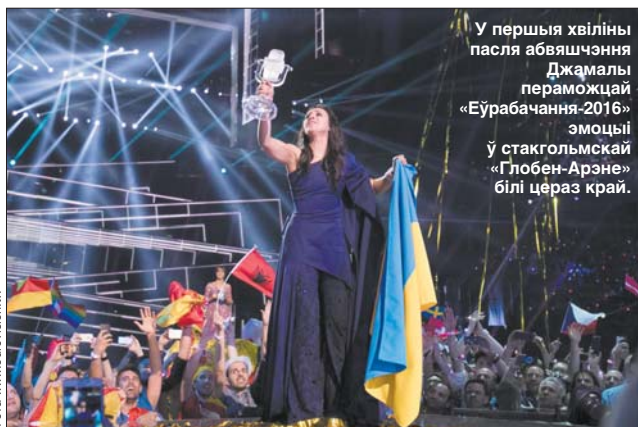
У першыя хвіліны пасля абвешчання Джамалы пераможцай «Еўрабачання-2016» эмоцыі ў стакольскай «Глобен-Арэне» білі цераз край.

ЛІЧБЫ І ФАКТЫ Нагадаем, сёлета ўпершыню пераможцу конкурсу вызначалі па новай схеме. Галасы прафесійных журы і тэлеглядачоў, трансфармаваныя ў балы ад 1 да 12, не суміраваліся ў суадносінах 50/50, а падлічваліся паасобку. Такім чынам у першую пяцёрку паводле версіі нацыянальных журы ўвайшлі (па ўзрастанні) Расія, Мальта, Францыя, Украіна і Аўстралія. Тэлевізійная аўдыторыя з 42 краін-удзельніц расставіла акцэнт на крыху інакш, і лідарамі ў глядачоў сталі аднаўраўнаважаныя Балгарыя, Аўстралія, Польшча (між іншым, у журы польскі Арамис стаў толькі 25-м!), Украіна і Расія. Як той казаў, адчуцце розніцы. А галоўнае, паспрабуйце часам судзіць аддалі «золата» Аўстраліі, глядачы — Расіі, а перамагла Украіна. Затое гэтая схема падліку галасоў практычна нівеліравала так званы «добра-расудскі прынцип», і сёлета многія краіны не абменьваліся найвышэйшымі блізкімі з геаграфічна блізкамі дзяржавамі, а рабілі кожная свой выбар, часам нават нечаканы. Беларусь, зрэшты, на абодвух франтах традыцыйна падтрымала перадусім Расію, якой і наша журы, і глядачы аддалі 12 балаў. Іншыя ацэнкі разышліся. Беларускія судзіць паставілі 10 балаў Літве, 8 — Швецыі, 7 — Украіне, 6 — Аўстраліі, 5 — Мальце, 4 — Бельгіі, 3 — Арменіі,