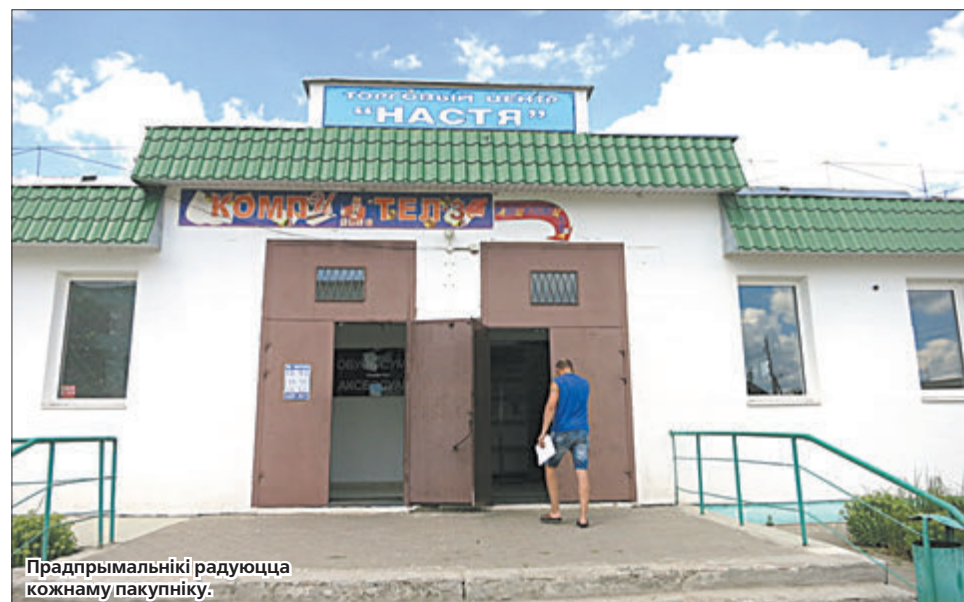
Прадпрымальнікі радуюцца кожнаму пакупніку.