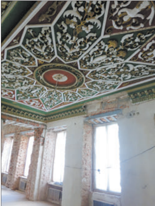
А столь як новая.