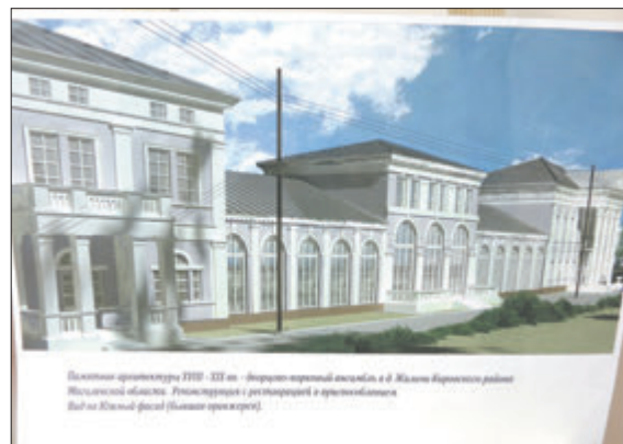
А вось гэтай часткі палаца пакуль наогул няма.

Па бясконцай анфіладзе пакоюў (а іх усяго ў палацы 100) можна меркаваць, з якім размахам жылі тут гаспадары. Распазнаць былою прыгажосць у гэтых паўразбураных памяшканнях цяжка, але немагчыма адраваць вачэй ад столяў. Ім больш за 150 гадоў, але фарбы такія насычаныя, што здаецца, былі пакладзены толькі ўчора. Ця амаль не пашкоджаны гіпсавую ляпніну, але кесонныя столі ў савецкі перыяд разабралі. У бальнай і банкетнай зале